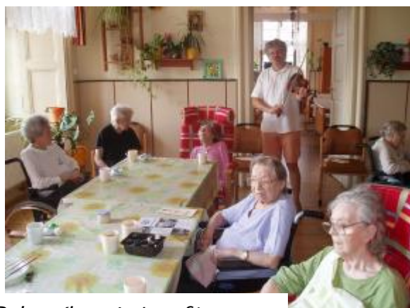
Byla příjemná atmosféra...