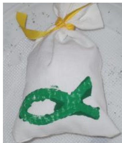
Takovéto krásné pytlíčky jste si, naši šikovní klienti, vyrobili.