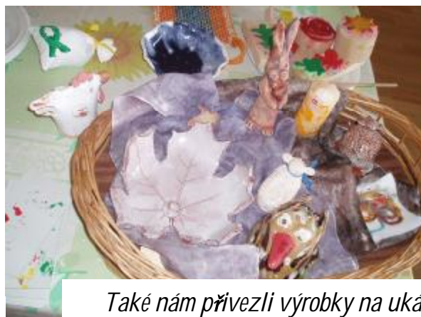
Také nám přivezli výrobky na ukázkou.